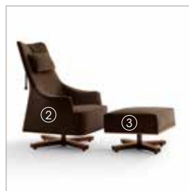
2 Mobius 63942 adamo&eva 7458/leather 9122 fin.11