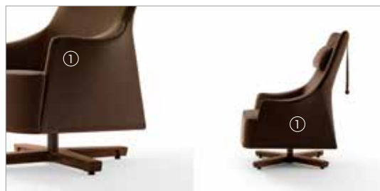
1 Mobius 63942 adamo&eva 7458/leather 9122 fin.11