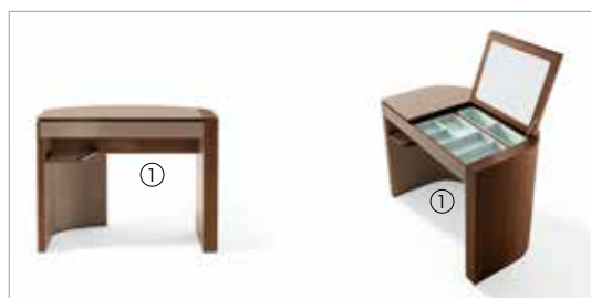
1 Venus 70080 saddle leather turtledove internal parts 7A fin.11