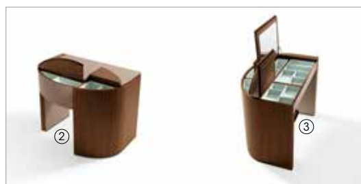
2 Venus 70080 saddle leather turtledove internal parts 7A fin.11